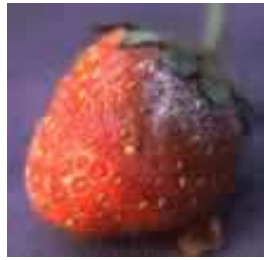
Botritis cinerea - Сиво гниеење на јагодите