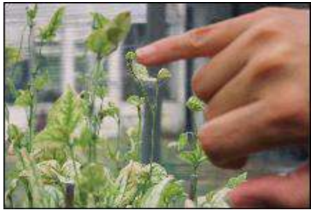
Штети од Tetranichus urticae