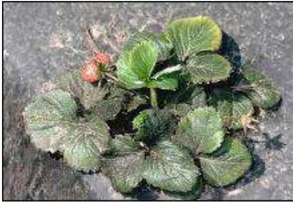
Штети предизвикани од лисни вошки кај јагодите