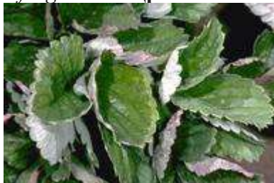
Sphaerotheca macularis – Пепелница