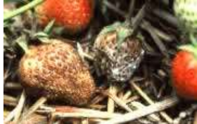
Colletotrichum acutatum – Антракноза на јагодите