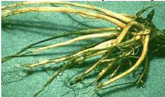
Rhizoctonia fragariae – Црно гниеење на коренот